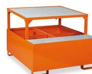
MG778 - Base para armazenagem e movimentação de cisternas de 1000 Lt., em chapa de aço e estanque, com suporte de operações para operações de transferência.