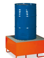
MG277 - Para 1 bidões 200m Lt.