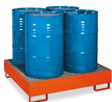
MG275 - Para 4 bidões 200m Lt.