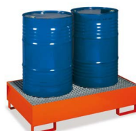
MG276 - Para 2 bidões 200m Lt.